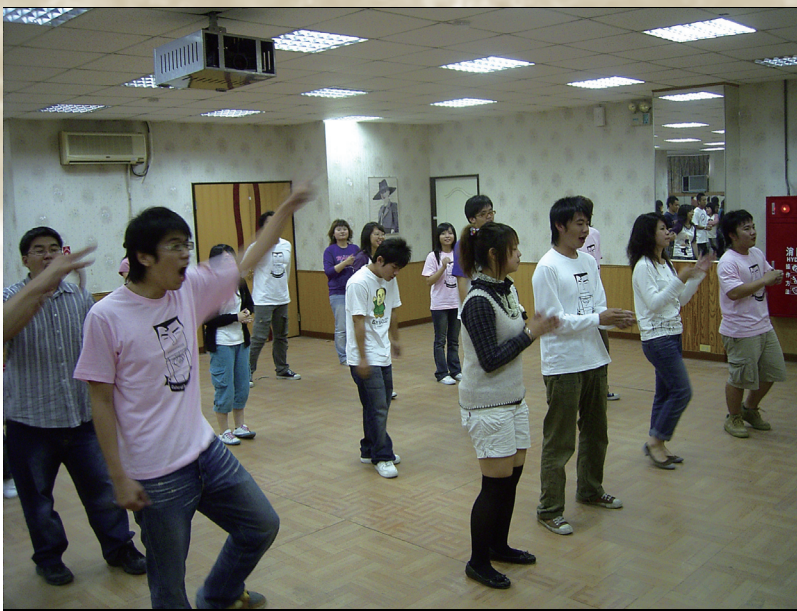
同學們課堂內即興創作的成果，在校園內展演。