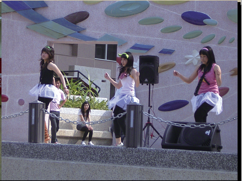
參與表演藝術訓練的同學，利用課堂即興創作的活動與方法，自編發展一套創意舞蹈。

聽覺的媒材，巧妙地運用，總是扣人心弦。「肢體」，指的是我們的身體的各個部分，它們之間不同的組合，總是會給我們一種視覺上的享受，它靜態時像雕像藝術、動態時像動畫藝術，肢體之間的巧妙搭配，總是讓人為之驚嘆，像是郭滿州（2005）在小學帶領的創作舞實施教學過程中，就充分地讓小朋友認識到頭、頸、肩、肘、腕、腰等部位，然後依照口令與節奏做不同的造型。身體與聲音，是當代表演藝術、思想與文化的思想起點（鍾明德，2002）。