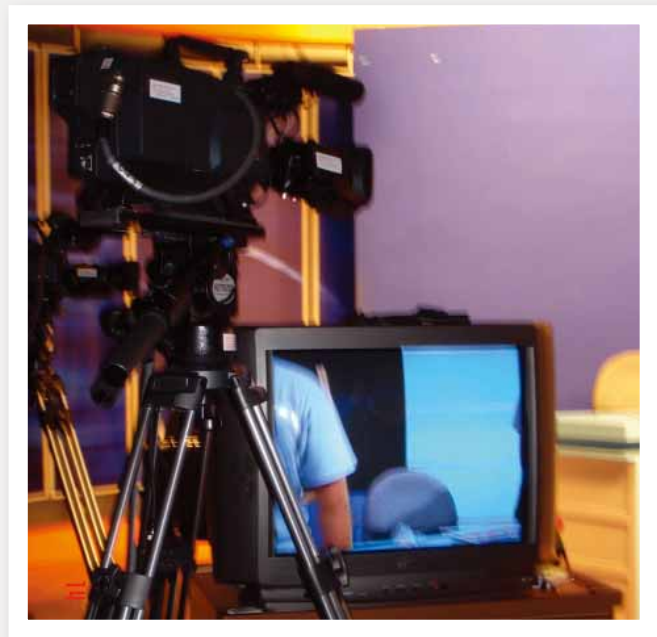
錄像表演 — 攝影機與電視機

〈誘惑〉試圖捕捉誘惑的表情。林宛萱刻意放大眼神的動態，表達正受誘惑的眼睛，當它掠取外在美妙事物時，它同時也展現了具有誘惑的美感！