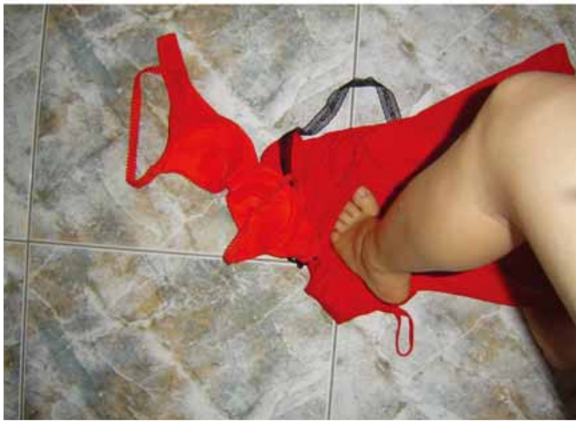
錄像作品 — 赤色組圖（珊瑚）

〈赤色〉將以赤色（紅色）作為主題，想通過紅色錄像，拼湊紅色對女性的束縛。作品中，當紅色化做繩結時，每一圈的運動象徵情感的牽綁、化做女人胸罩時，它是年輕女孩的現實主義。