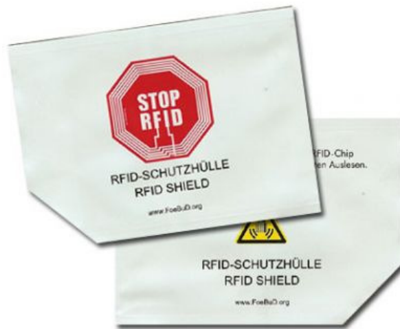
圖 3 貼有阻隔標籤的紙袋