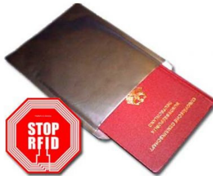
圖 2 貼有阻擋標籤的護照封套

圖 2 和圖 3 為貼有阻擋標籤之護照封套及紙袋，在封套跟紙袋周圍或內部的標籤即受到保護，任何讀取器將無法讀取這些標籤。