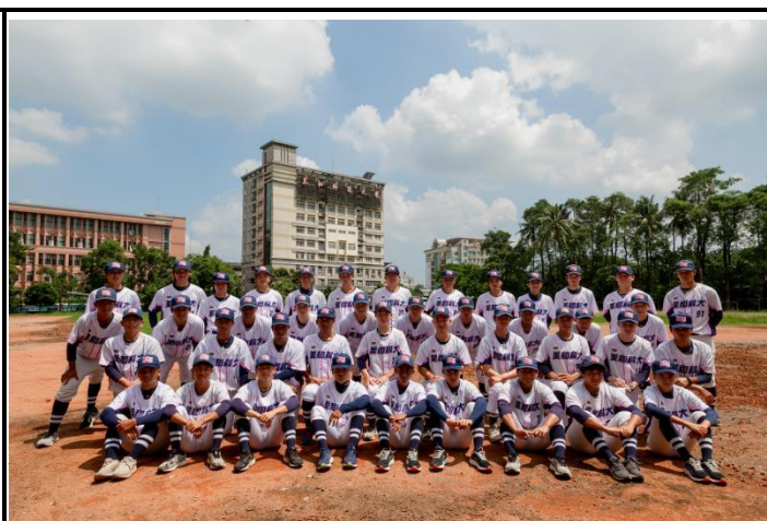
美和科大棒球隊全隊大合照