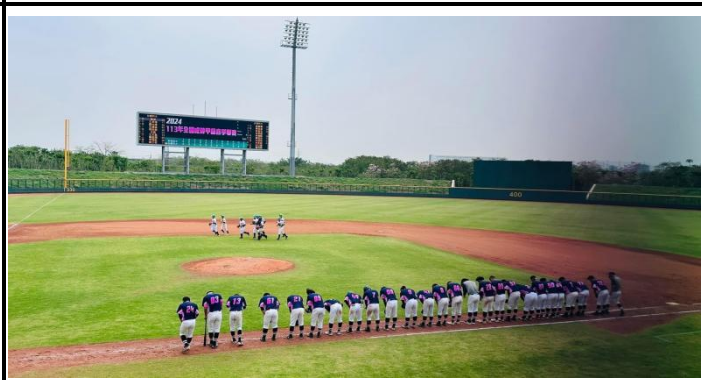
參加 113 年全國成棒甲組春季聯賽