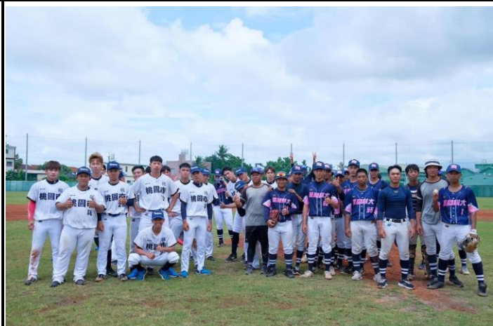
移地訓練-桃園航空城