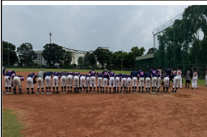
移地訓練-高雄台電