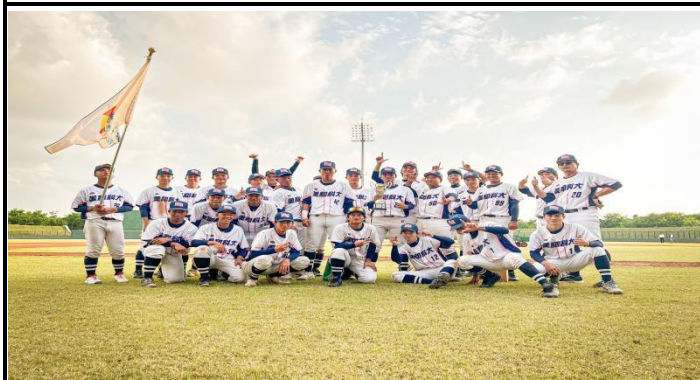
台南參加 2024 梅花旗棒球賽