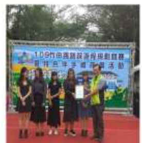
圖：申請人指導學生獲得競賽成績一覽表（109年11月15日）