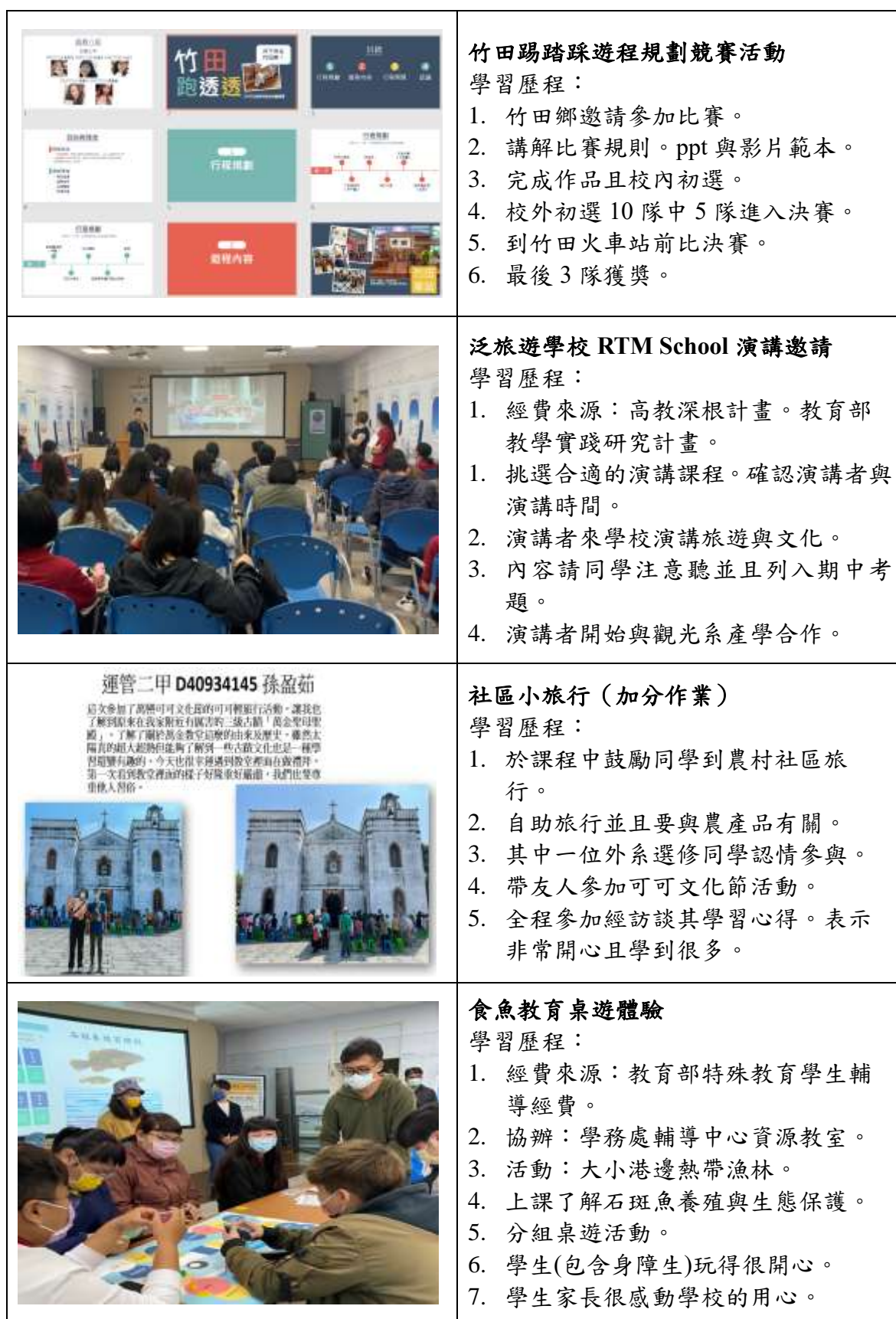
表 4：教學歷程之評估彙整表

鄉公所「2022 可可產業文化節」與相關教學活動的資料。因此，教學歷程之評估就以照片來呈現。如下表 4 所示。