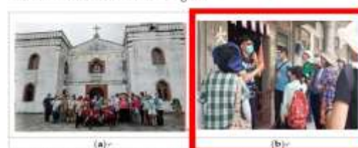
Figure 2. Sustainability learning activity through rural community travel: (a) Wanshan Basilica, the oldest Catholic church in Taiwan; and (b) The biggest traditional Hakka cultural settlement in Taiwan. All the learners paid attention and listened to how sustainable development can be a part of community and human involvement. One of authors was the tour guide (center of photo) (b).

captured many photos and videos. Before and after the tour, all team members discussed the advantages and disadvantages of the learning activities. Therefore, two photos were selected to explain the effects of environmental psychology on sustainability learning. The observational results are shown in Figure 2.