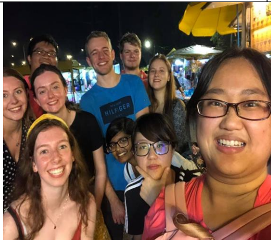
說明：國際同學交流，跨文化學習。