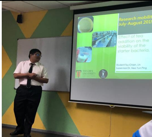
說明：實習學生全英文期末報告。