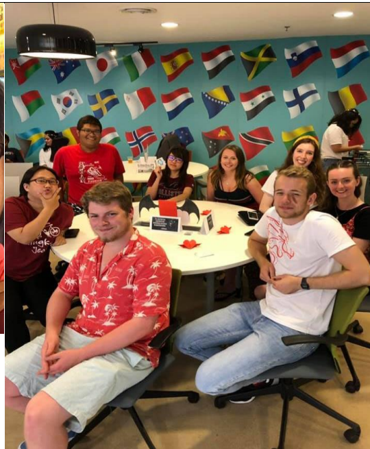
說明：與國際學生合影，友誼長存。