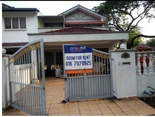
說明：實習生租屋地點外觀。