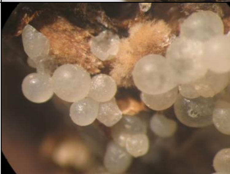
黃色癭蠅 ( Mycophila speyeri )