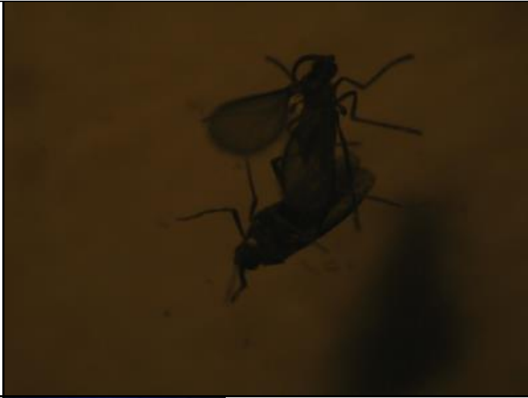
簡易組裝誘蟲燈於菇舍大量誘殺蕈蠅情形