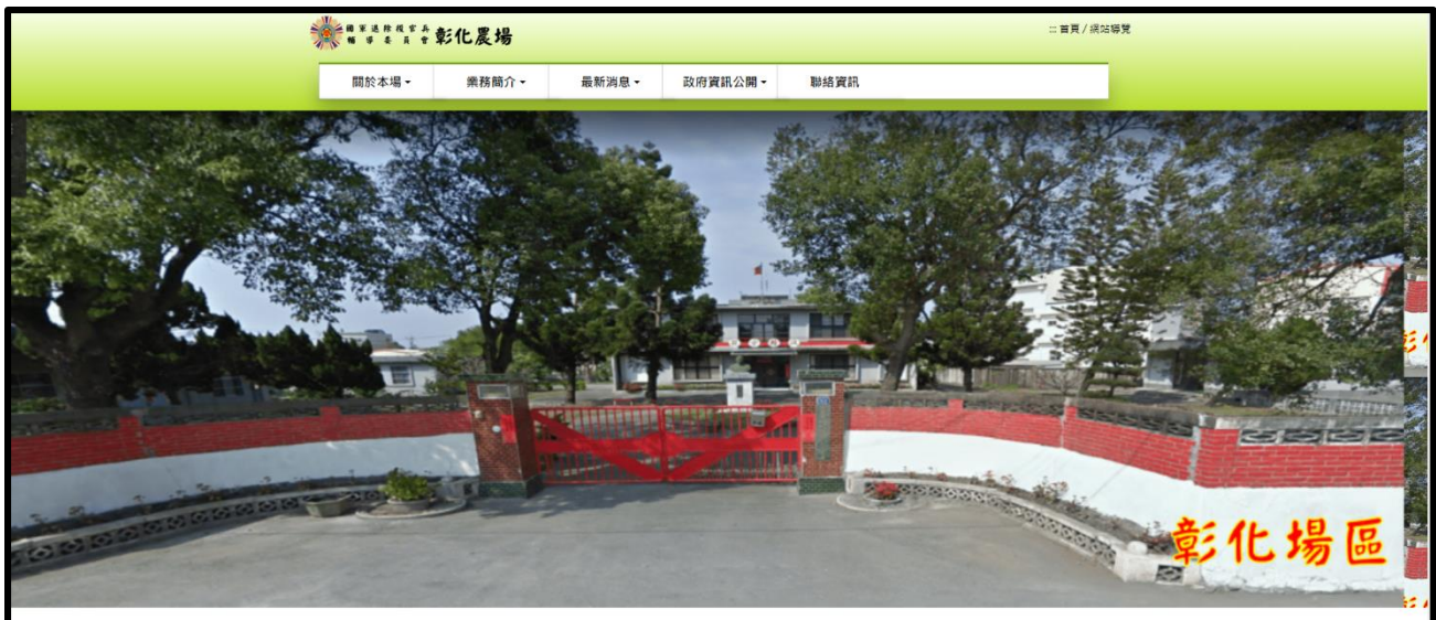
圖 4. 首頁版面呈現畫面

6. 各網頁內容文字色彩及背景色調，依版面風格採一致性版面配置呈現，農場內各種設施、環境、活動等照(影)片，由彰化農場提供現有適當之照(影)片，如無適當之照(影)片則由參與本專案之工讀學生赴現場實地重拍攝，及做必要之編修、剪輯處理程序。