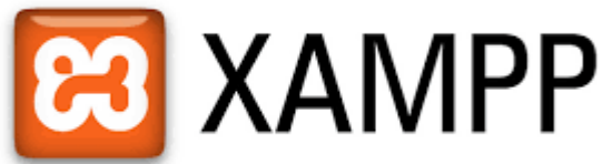
圖 2. XAMPP Logo