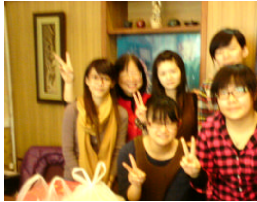
芝露華國際美容有限公司